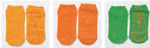
イエロー オレンジ グリーン