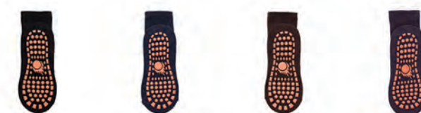
ブラック ネイビー ブラウン パープル