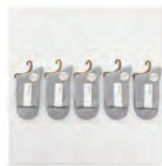
レディースグレー