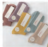
レディースニュアンス