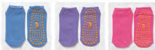
スカイブルー ラベンダー ピンク

S : 14 - 18cm M : 18 - 22cm L : 大人フリーサイズ (22 - 25cm)