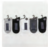
メンズモントーン

薄手なのに軽起毛であったか。 季節の変わり目にあると便利！ コーデのアクセントにもなる高見えアイテム。