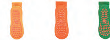
イエロー オレンジ グリーン