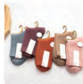
レディースクラシック