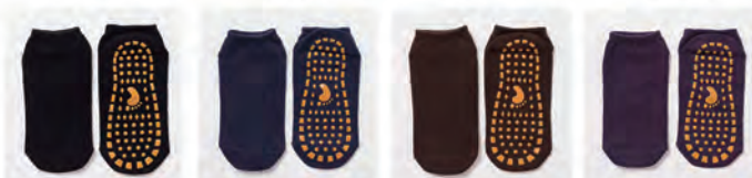
ブラック ネイビー ブラウン パープル