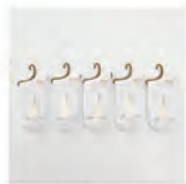
レディースホワイト

レディース：22.0-25.0cm (フリーサイズ) メ ン ズ：25.0-27.0cm (フリーサイズ)