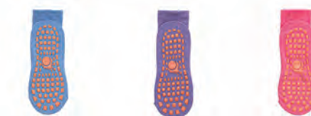
スカイブルー ラベンダー ピンク

S : 14 - 17cm M1 : 17 - 20cm M2 : 20 - 22cm L : 大人フリーサイズ(22 - 25cm)