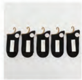
レディースブラック